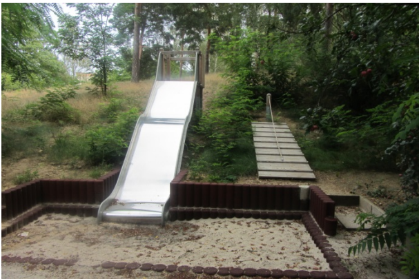
Eine Hangrutsche (hier ein Beispiel aus Ludwigsfelde) soll für die Kita angeschafft werden

Die Fördergesellschaft hat die Anschaffung einer neuen Rutsche für die Betriebs-Kita der FH Bielefeld unterstützt. In der Kita werden Kinder von Beschäftigten und Studierenden betreut. Die Rutsche wird am 31. März 2017 aufgebaut, deshalb lagen zum Redaktionsschluss noch keine Fotos vor.