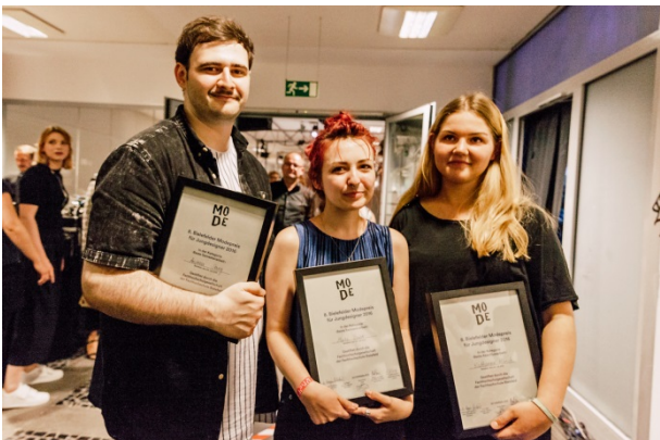
Die Preisträger 2016