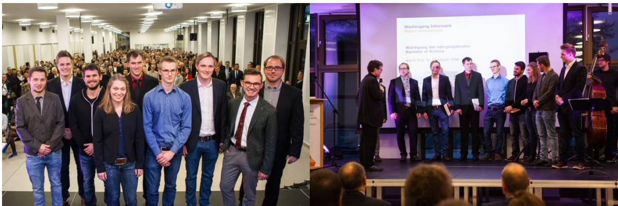
Absolventenverabschiedung auf dem Campus Minden

Die jeweils Besten eines Studiengangs werden am Campus Minden traditionell mit einem Buchpreis geehrt, 2016 wurden erstmals alle Absolventinnen und Absolventen zusammen in der neuen Mensa verabschiedet.