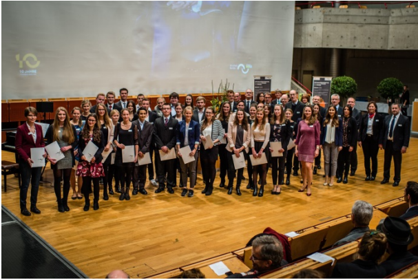
Stipendiaten 2016

Die Fördergesellschaft vergibt zwei Leistungsstipendien in Höhe von je 1.800 Euro / Jahr und ein Sozialstipendium in Höhe von 1.000 Euro / Jahr über den Studienfonds OWL.