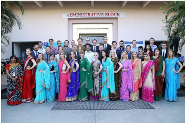
In Vadadora / Indien

29 Studierende verbringen eine vierwöchige „Indien Summer School“ an der Parul University in Vadodara. Die Fördergesellschaft ist hier in der Finanzierung relativ großzügig eingesprungen, weil andere Mittel, die eingeplant waren, kurzfristig entfallen sind.