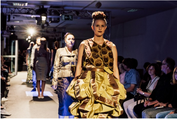
Modenschau 2016

Die Durchführung der Modenschau 2016 hat die Fördergesellschaft mit 1.000 Euro unterstützt.