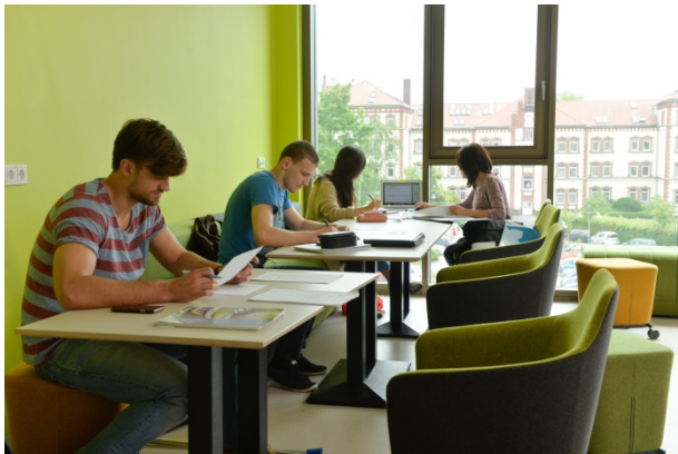
Meeting Point im Neubau

Die Fördergesellschaft hat die Möblierung der sogenannten Meeting Points im Neubau auf dem Campus Minden unterstützt. Die Flächen stehen den Studierenden zum freien Lernen zur Verfügung. Die Mittel kamen aus einer zweckgebundenen Spende der Sparkasse Minden-Lübbecke.